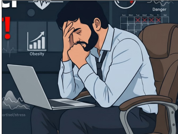
का खतरा कहीं ज्यादा देखा जा रहा है। इसके अलावा ऑफिस के काम के चलते बढ़ता स्क्रीन टाइम और शारीरिक गतिविधि कम होने से शरीर की कैलोरी बर्न करने की क्षमता घटती है। ये सभी गंभीर बीमारियों को बढ़ाने वाली मानी जाती हैं। इन्हें जोखिमों को कम करने के लिए अब विशेषज्ञ पांच की जगह चार-दिवसीय कार्य सप्ताह की सलाह दे रहे हैं। आइए जानते हैं इसके पीछे का क्या तर्क है और क्या ये वास्तव में फायदेमंद साबित हो सकता है स्वास्थ्य विशेषज्ञ कहते हैं, कर्मचारियों में बढ़ती स्वास्थ्य समस्याओं, विशेषतौर पर मोटापे के खतरे को देखते हुए हफ्ते में 5 की जगह 4 वर्किंग डे करने पर विचार किया जाना चाहिए। कम

अमेरिकन हार्ट एसोसिएशन की रिपोर्ट बताती है कि रोजाना लंबे समय तक बैठने वालों में हृदय रोग, हाई ब्लड प्रेशर और मोटापे का खतरा अधिक हो सकता है। ऑफिस जाँब करने वालों में इसका जोखिम और बढ़ जाता है। इन्हें खतरों को देखते हुए अब विशेषज्ञ सलाह में चार वर्किंग डे करने की सलाह दे रहे हैं। सुबह जल्दी उठकर ऑफिस पहुंचना, घंटों कुर्सी पर बैठकर लैपटॉप की स्क्रीन से चिपके रहना, मीटिंग्स का दबाव और देर रात तक काम, ये सब मौजूदा समय का आम वर्किंग कल्चर बन गया है। नौकरी की डिमांड के हिसाब से ये जरूरी भी है, पर क्या आप जानते हैं कि ये आदतें आपकी सेहत के लिए इतने बड़े खतरे को न्योता दे रही हैं जिसका ज्यादातर लोगों को अंदाजा तक नहीं होता है। विशेषज्ञ कहते हैं, लॉन्ग वर्किंग ऑवर्स यानी दिन में 8-10 घंटे काम और लगातार बैठे रहने की आदत धीरे-धीरे शरीर को बीमार बना रही है। लिहाजा मोटापा, हाई ब्लड प्रेशर, तनाव, डिप्रेशन, डायबिटीज और हृदय रोग जैसी समस्याएं अब युवाओं में तेजी से बढ़ती देखी जा रही हैं। अध्ययनों से पता चलता है कि रोजाना 8-10 घंटे तक लगातार बैठकर काम करने वालों में मोटापे