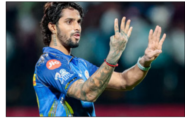
के दौरान छह चौके और छह छक्के लगाए। वहीं, शार्दुल ठाकुर ने शानदार गेंदबाजी करते हुए चार ओवर के स्पेल में 39 रन देकर चार विकेट निकाले। जीत के बाद कप्तान बुमराह ने तिलक की बल्लेबाजी और शार्दुल के स्पेल को मैच का टर्निंग पॉइंट बताया। जीत के बाद बुमराह ने कहा, 'मुझे लगता है कि तिलक की पारी और शार्दुल ने जिस तरह से गेंदबाजी की, दोनों को बराबर श्रेय मिलना चाहिए। जिस तरह से

करने को लेकर बुमराह ने कहा, 'हां, बतौर कप्तान यह पहला मैच था। मैंने जैसा कहा, मैंने एक टेस्ट मैच में कप्तानी की है। मैंने टी20 इंटरनेशनल में कप्तानी की है। अब सिर्फ वनडे क्रिकेट का गेम बचा है। हालांकि, मुझे नहीं लगता कि ऐसा होगा (हंसते हुए), लेकिन मजाक छोड़िए। सच में बहुत खुश हूँ। मैंने कप्तानी का खूब आनंद लिया। मौसम और ग्राउंड अच्छा था।' बुमराह ने माना कि अंत के ओवरों में अब गेंदबाजी करना मुश्किल होता जा रहा है। उन्होंने कहा, 'यह क्रिकेट का अच्छा मैच था। दोनों टीमों ने अच्छा क्रिकेट खेला। अच्छी शुरुआत के बाद हमने सच में वापसी की। आखिर में थोड़ी सी चूक हुई जब हमने कुछ कैच छोड़े, लेकिन मुझे लगता है कि अब आखिर में गेंदबाजी करना ज्यादा मुश्किल हो गया है। हां, हमने प्लान किया था कि हम धीमी गति की गेंदों और स्टंप्स की लाइन में गेंदबाजी करेंगे।