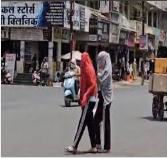
प्रदेश में भीषण गर्मी का दौर बना रहा। शाजापुर और छतरपुर के