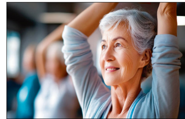
कि भारत में जिन बुजुर्गों की मानसिक क्षमता बेहतर है, पोषण अच्छा है और चलने-फिरने की ताकत ठीक है, उनके लंबे वक्त तक जीवित रहने की संभावना अधिक होती है। अखिल भारतीय आयुर्विज्ञान संस्थान (एम्स), राष्ट्रीय स्वास्थ्य सेवा ट्रस्ट और ब्रिटेन की यूनिवर्सिटी हॉस्पिटल्स ससेक्स के शोधकर्ता ने अध्ययन के दौरान ये नतीजे निकाले हैं। बुजुर्गों आबादी की स्वास्थ्य योजनाएं बनाने वक्त केवल बीमारियों पर ही नहीं, बल्कि उनकी कार्यक्षमता पर भी ध्यान देना जरूरी है। ये अध्ययन भारत में वृद्धावस्था अध्ययन के आंकड़ों पर आधारित था। इसमें 60 साल या उससे अधिक उम्र के 4,096 लोगों के आंकड़ों का विश्लेषण किया। इनमें से अध्ययन के अंत तक 951 बुजुर्गों की मौत हो गई। विशेषज्ञों की टीम ने कहा कि अब

द लैंसेट में प्रकाशित अध्ययन ने खुलासा किया है कि जो बुजुर्ग मानसिक रूप से सक्रिय रहते हैं, शारीरिक रूप से हल्के-फुल्के काम करते रहते हैं और पोषक तत्वों का सेवन करते हैं, उनके लंबे समय तक जीवित रहने की संभावना कहीं ज्यादा होती है। उम्र बढ़ने के साथ शरीर कमजोर होने लग जाता है, इस समय विशेष देखभाल और पोषण की आवश्यकता होती है। लेकिन क्या आप जानते हैं कि किसी बुजुर्ग की लंबी उम्र सिर्फ दवाइयों पर नहीं, बल्कि उनके तेज दिमाग, अच्छे पोषण और चलने-फिरने की क्षमता पर भी निर्भर करती है हाल ही में सामने आए एक बड़े शोध ने इसी सोच को नई दिशा दी है। द लैंसेट में प्रकाशित अध्ययन ने खुलासा किया है कि जो बुजुर्ग मानसिक रूप से सक्रिय रहते हैं, शारीरिक रूप से हल्के-फुल्के काम करते रहते हैं और पोषक तत्वों का सेवन करते हैं, उनके लंबे समय तक जीवित रहने की संभावना कहीं ज्यादा होती है। विशेषज्ञों का मानना है कि दुनिया के कई देश जहां बुजुर्गों की आबादी तेजी से बढ़ रही है, वहां सिर्फ बीमारी का इलाज काफी नहीं होगा। उम्रदराज लोगों की संपूर्ण कार्यक्षमता और संतुलित पोषण जरूरी है। द लैंसेट में छपे अध्ययन में शोधकर्ताओं ने बताया