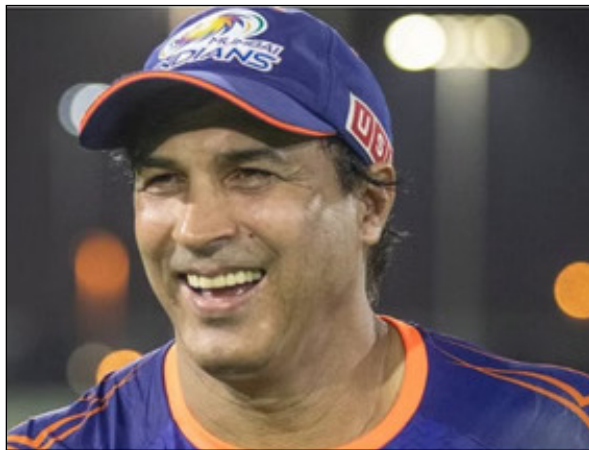
कर लिया है। हालांकि मैं 2022 के बाद से आईपीएल टीम के स्पोर्ट स्टाफ का हिस्सा नहीं था, लेकिन इस साल एमिरेट्स लीग की टीम से भी मेरा सफर समाप्त हो गया।' पूर्व भारतीय खिलाड़ी ने मुंबई इंडियंस परिवार और फैंस का आभार भी जताया। उन्होंने कहा, '2010 से शुरू हुए इस शानदार सफर में समर्थन देने के लिए पूरी मुंबई इंडियंस फैमिली

पूर्व भारतीय ऑलराउंडर रॉबिन सिंह ने मुंबई इंडियंस फ्रेंचाइजी के साथ अपना 16 साल पुराना रिश्ता खत्म कर लिया है। उन्होंने सोशल मीडिया पोस्ट के जरिए इसकी जानकारी दी। रॉबिन 2010 से मुंबई इंडियंस के साथ जुड़े हुए थे और टीम के पांच आईपीएल खिताब जीतने में अहम भूमिका निभाई थी। उन्होंने मुंबई इंडियंस के साथ-साथ एमआई अमीरात से भी अलग होने का फैसला किया है। उनके इस ऐलान के बाद फैंस और क्रिकेट जगत में भावुक प्रतिक्रियाएं देखने को मिल रही हैं। रॉबिन सिंह ने शुक्रवार को सोशल मीडिया पर पोस्ट शेयर कर बताया कि अब उनका मुंबई इंडियंस और एमआई अमीरात के साथ सफर खत्म हो गया है। रॉबिन सिंह ने लिखा, 'मैं यह साझा करना चाहता हूँ कि मैंने आधिकारिक तौर पर मुंबई इंडियंस से अलग होने का फैसला